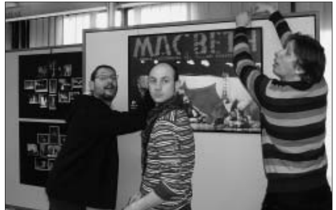
Pripremio: Davor Dokleja