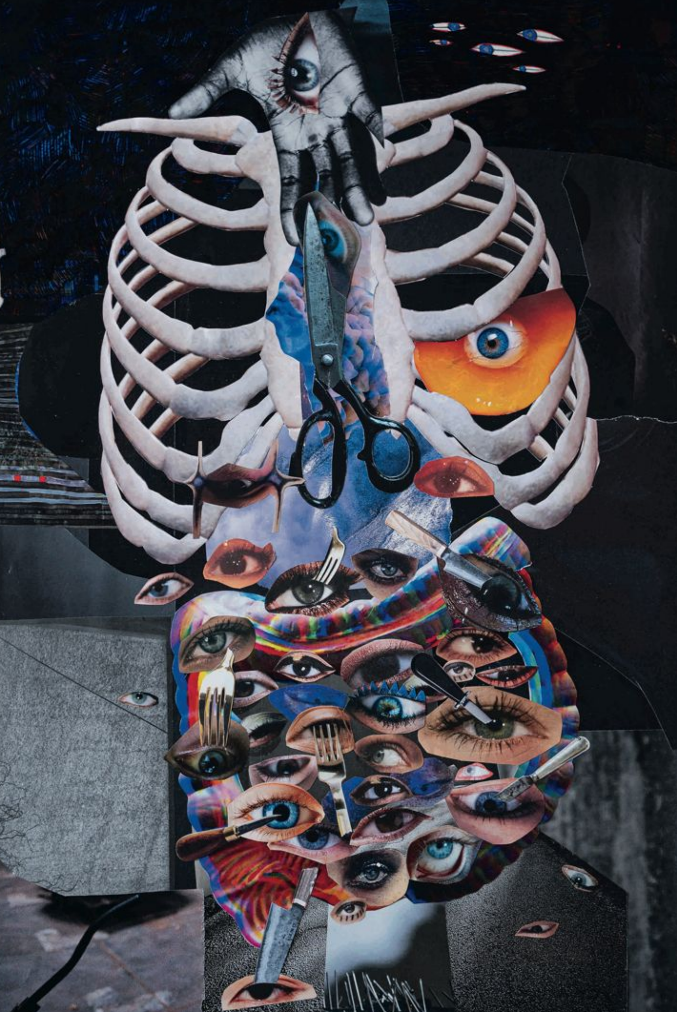
See/Unsee, kolaž, 50x70 cm