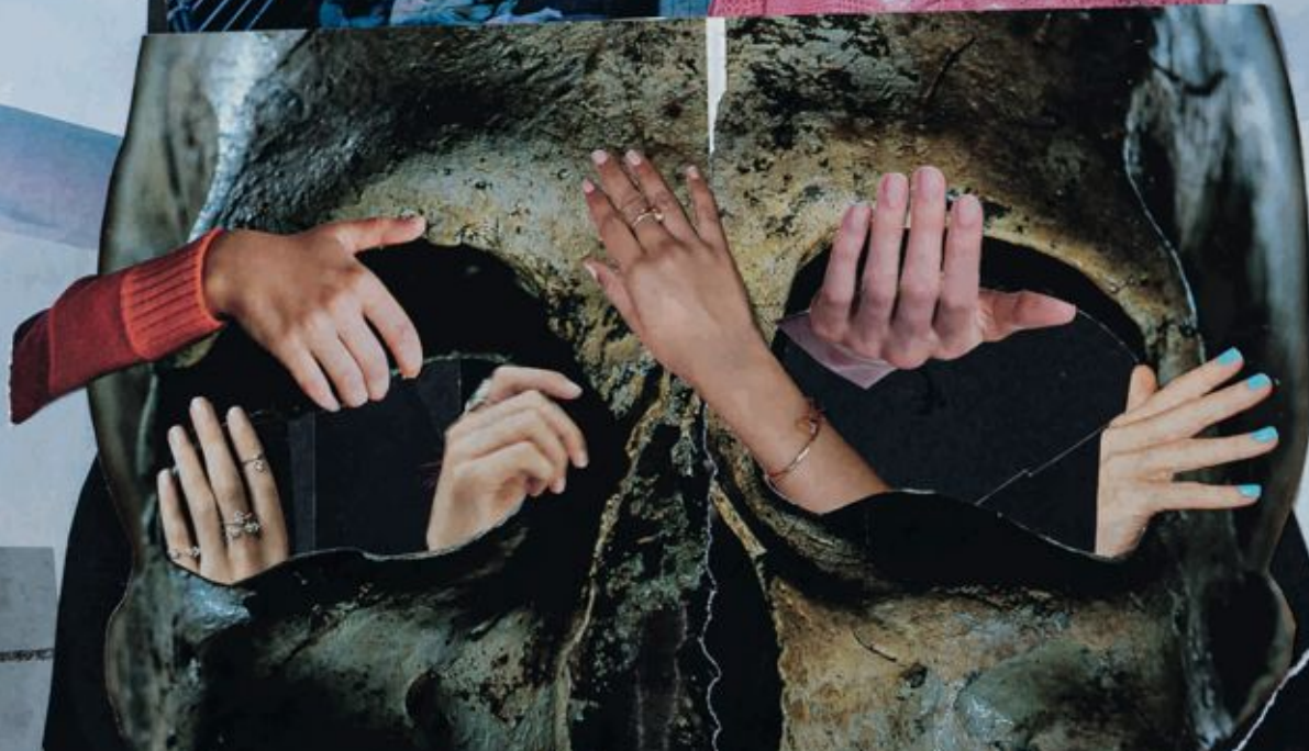
Feeling feelings of..., kolaž, 50x70 cm