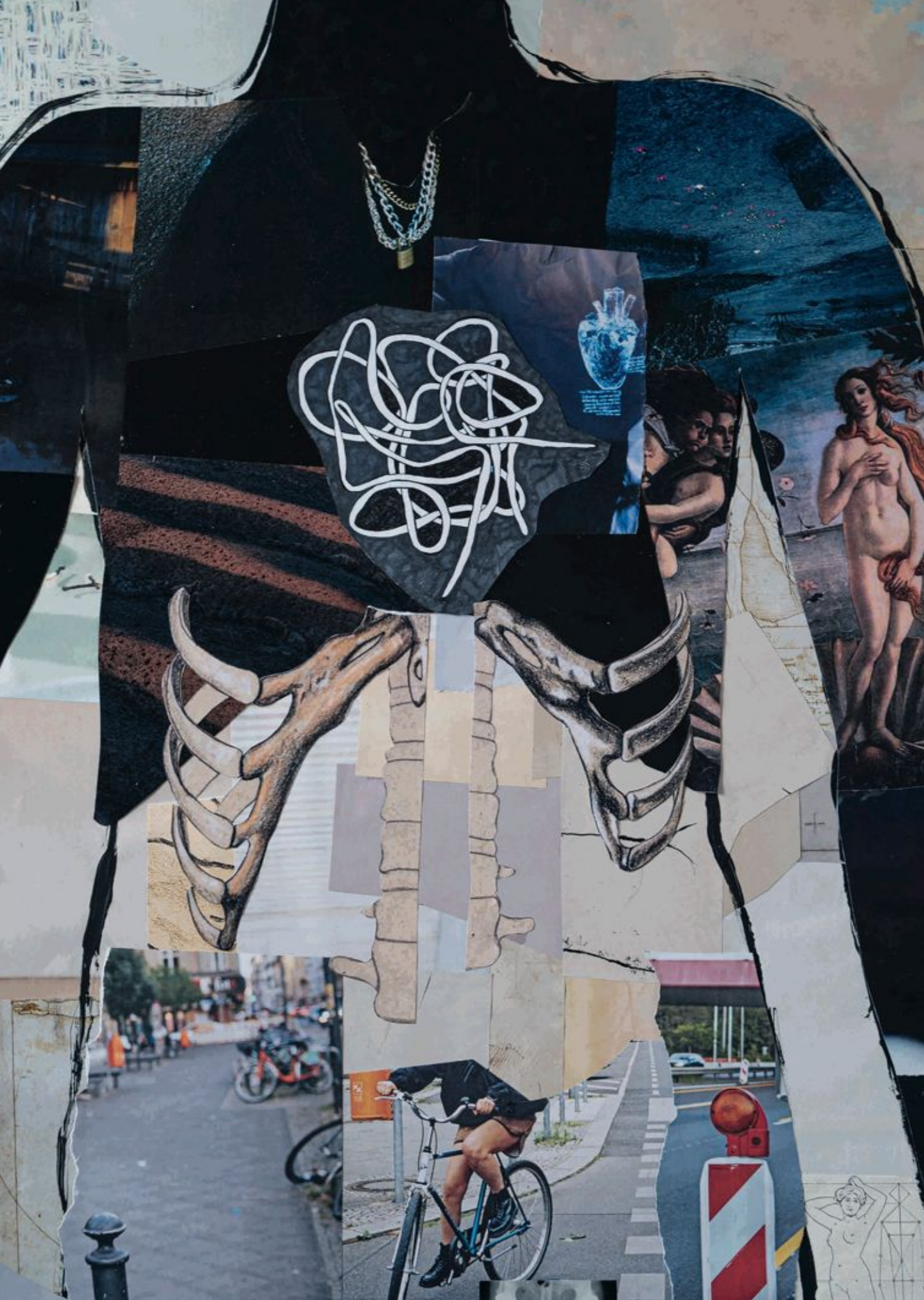
Hole in the stomach/Anxiety knot, kolaž, 50x70 cm