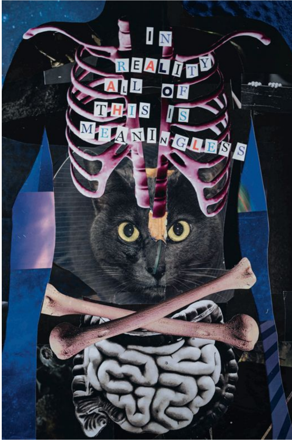
Meaningless, kolaž, 50x70 cm