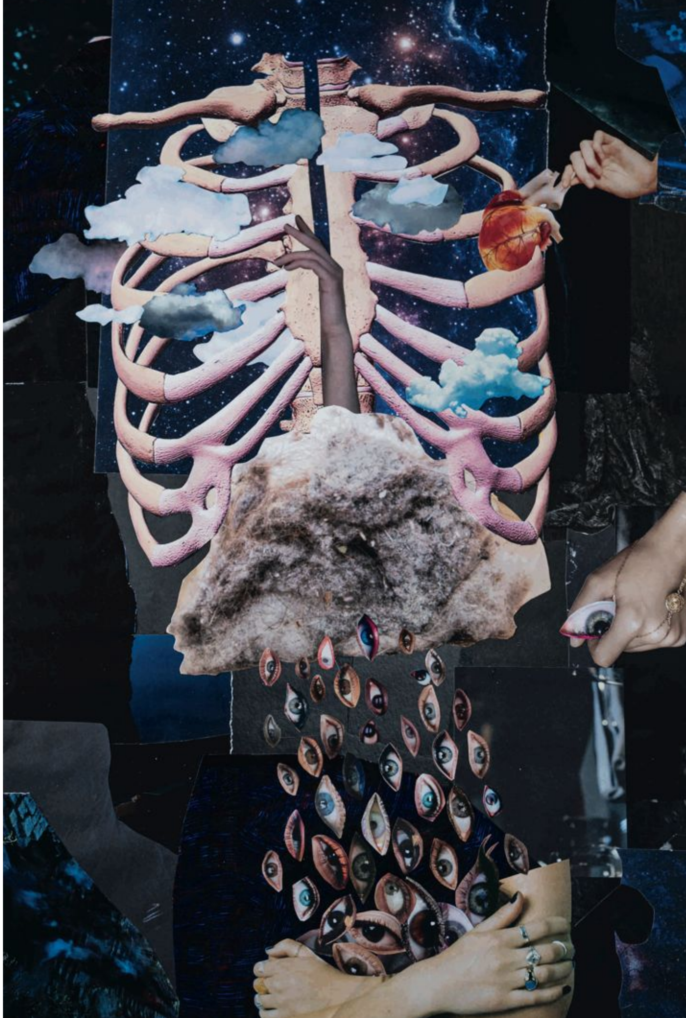
Defense mechanism, kolaž, 50x70 cm