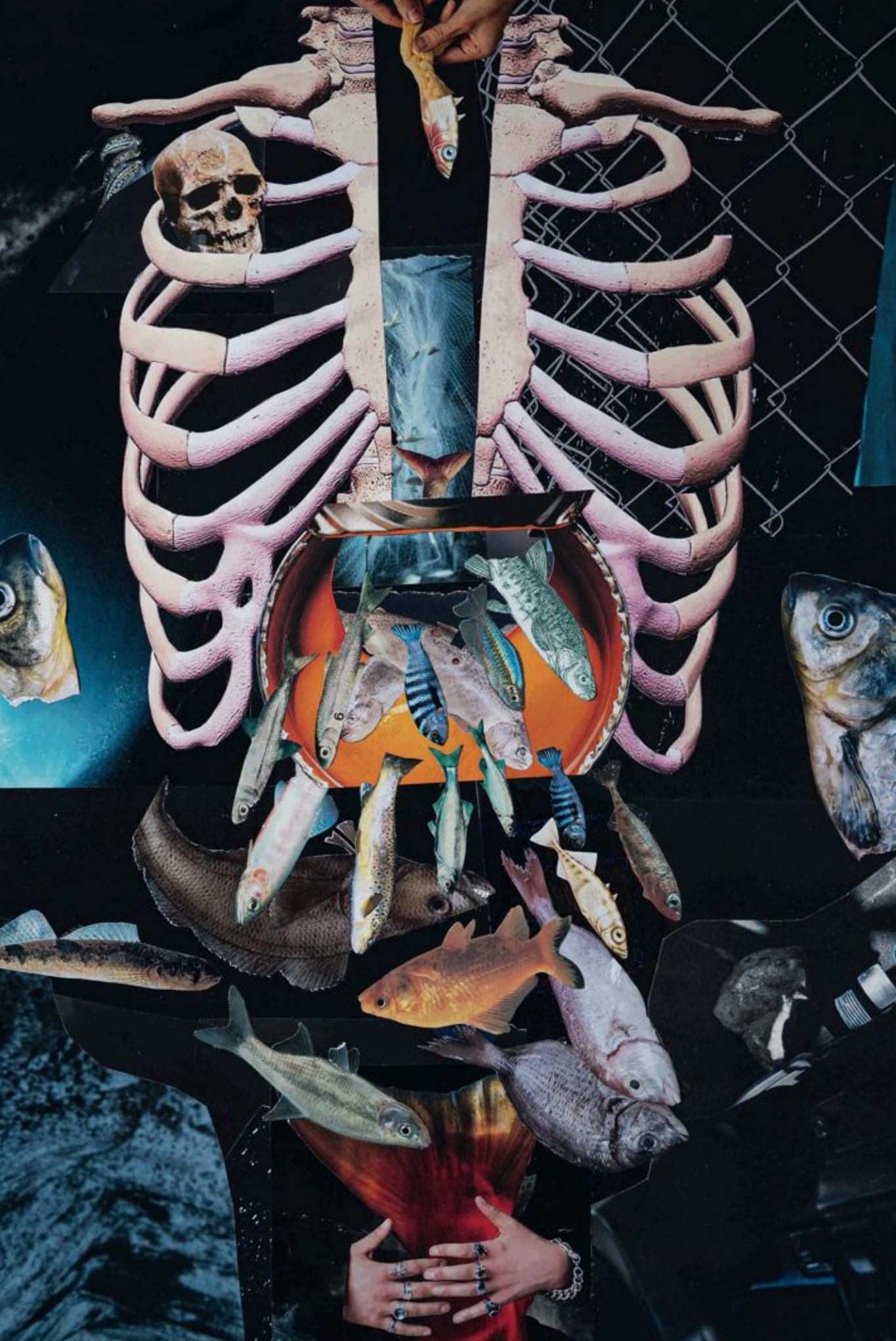
Rot, kolaž, 50x70 cm